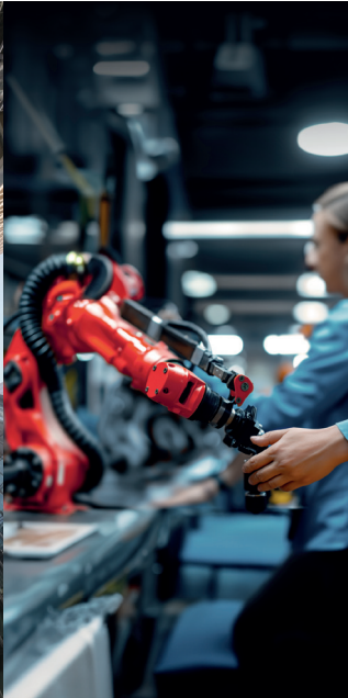
Unternehmens- finanzierung Private Debt