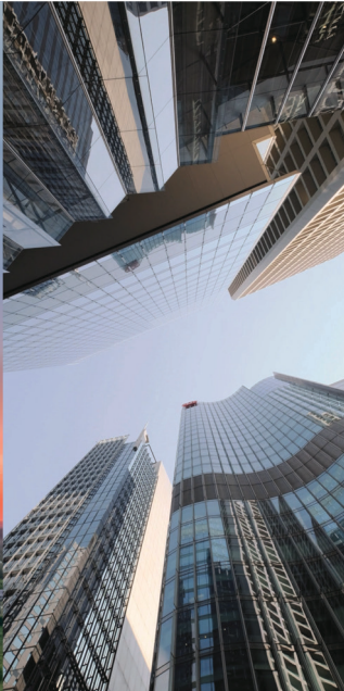
Immobilien Real Estate