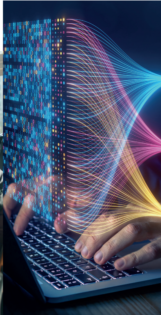
Alternative Strategien Alternative Strategies

NEUE WEGE GEHEN MIT ALTERNATIVEN INVESTMENTS